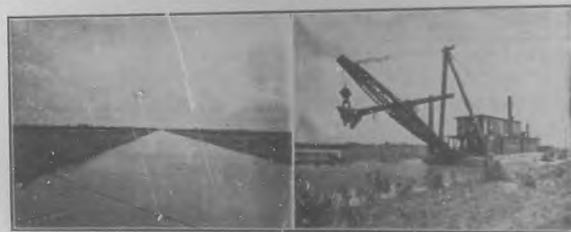
Nuevitas.—Canal que une las bahías Mayanabo y Savinal.—Draga "Nuevitas".