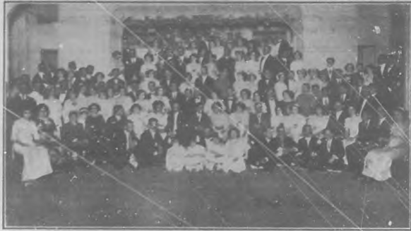
Grupo de algunos concurrentes á la fiesta que en la noche del 19 se celebró en la morada del Presidente del Liceo de Jesús del Monte (hoy llamado José Pedro Gay)

El día 22 de Marzo constituirá para nuestro insigne compatriota Capablanca una fecha grata por cuanto el Ayuntamiento en sesión solemne, después de cal-