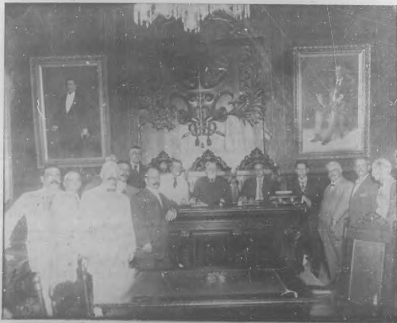
Solemne sesión en el Ayuntamiento en honor de Raúl Capablanca.

En números sucesivos y en forma original, BOHEMIA seguirá publicando trabajos de arte consagrados por la crítica y que constituirán una bella colección.