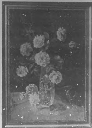
FLORES.—Oleo por María Melero.

Son sus ojos seductores tan hermosos y brillantes que nos transportan amantes á ensueños dulces de amores.