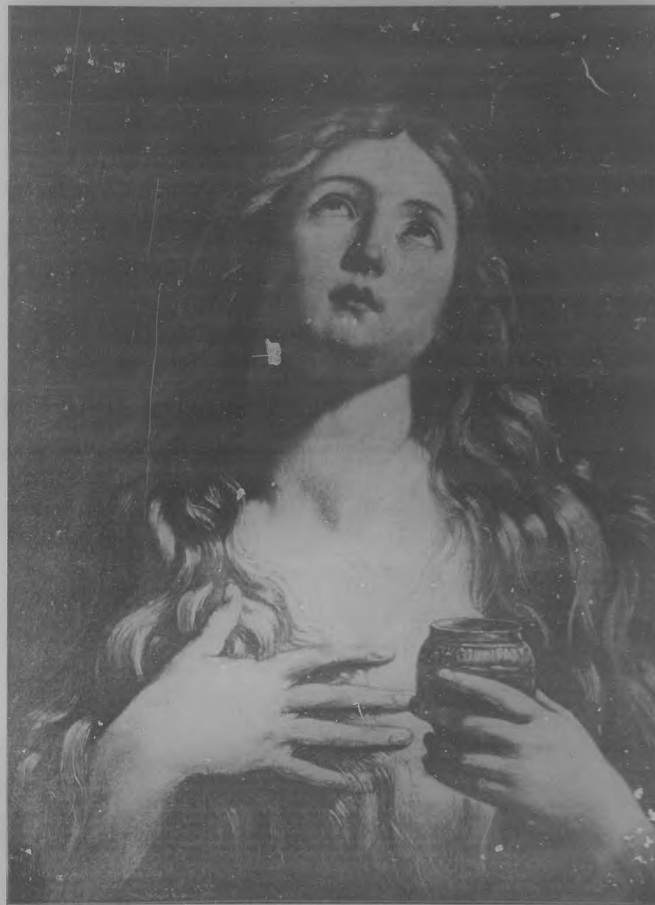
SANTA MARIA MAGDALENA

CUADRO DE GUIDO RENI EXISTENTE EN LA GALERIA DEL PRINCIPE DE LICHTENSTEIN, EN VIENA.