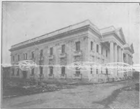
Santa Clara.—Una vista del Palacio Provincial próximo á ser inaugurado.

rosos panegíricos que hicieron oradores elocuentes, le concedió una medalla y diploma como distinción especial del pueblo Habanero orgulloso de los triunfos del campeón del ajedrez.